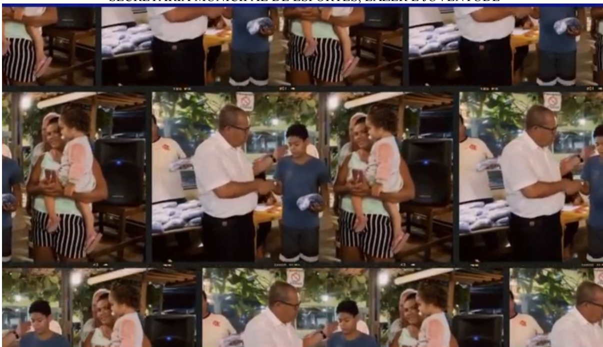
ENTREGA DE MATERIAL ESPORTIVO PROJETO “BOM DE ESCOLA, BOM DE BOLA” – PRAIA GRANDE