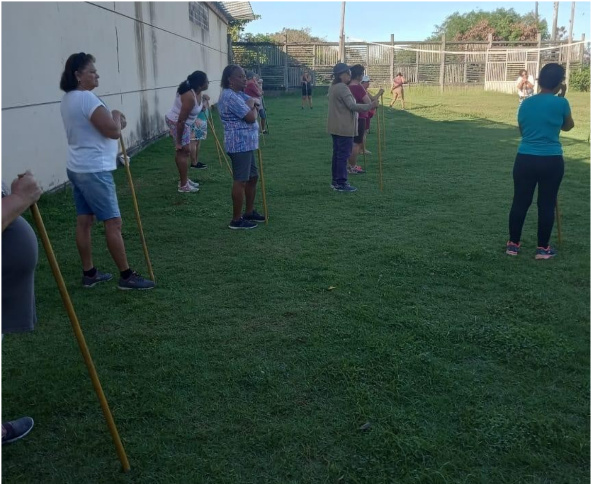
GINASTICA MELHOR IDADE – PRAIA GRANDE