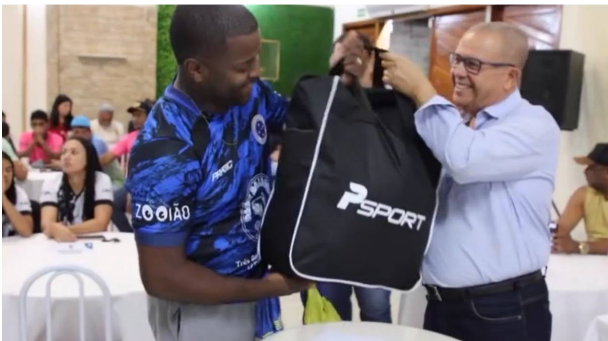
ENTREGA DOS MATERIAIS ESPORTIVOS AS EQUIPES DE FUTEBOL AMADOR MUNICIPAL QUE PARTICIPARAM DA 4ª COPA MARIO GARCIA