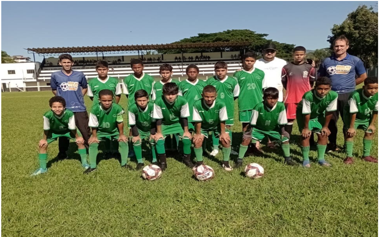
AMISTOSO FUNDÃO X JOÃO NEIVA