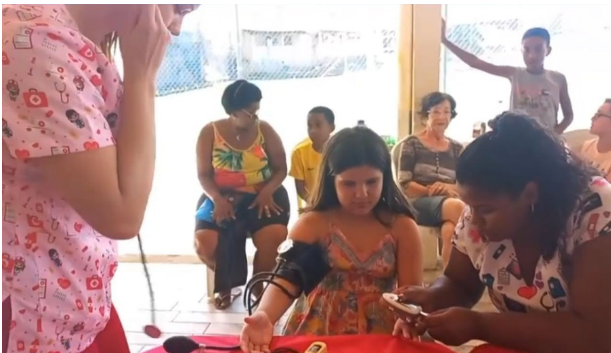
AVALIAÇÃO MULTIPROFISSIONAL DO PROJETO “BOM DE ESCOLA, BOM DE BOLA” – TIMBUÍ