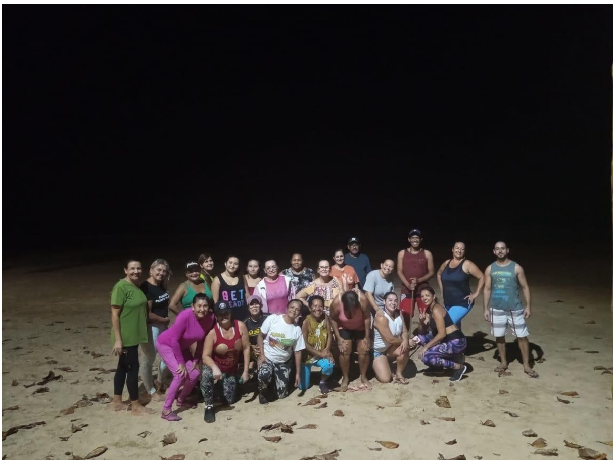
CIRCUITO FUNCIONAL - PRAIA GRANDE