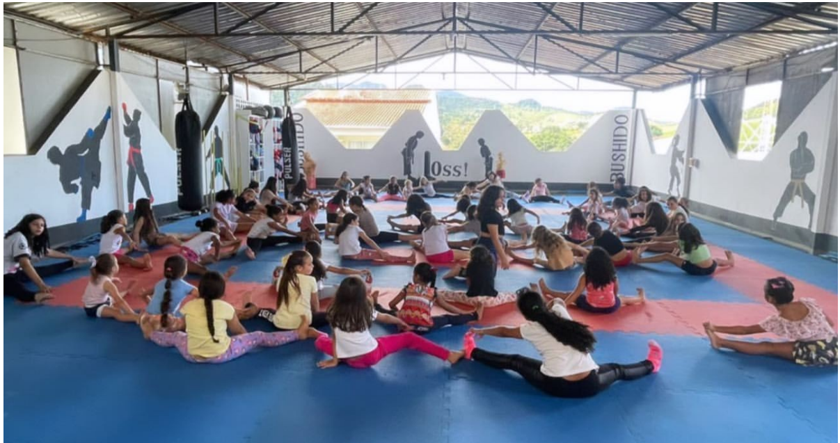
GINASTICA RÍTMICA – CENTRO