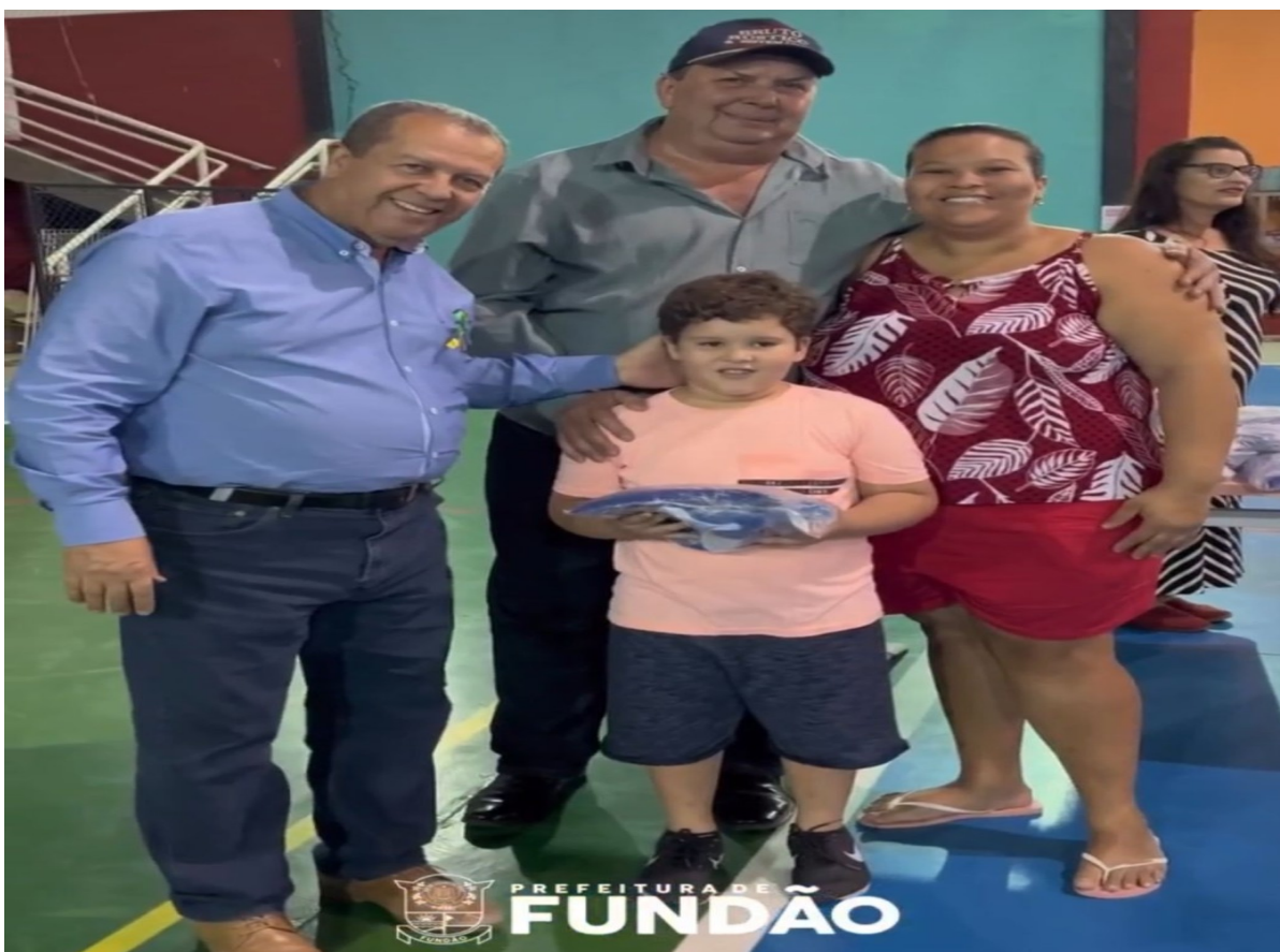
ENTREGA DO MATERIAL ESPORTIVO DO PROJETO “BOM DE ESCOLA, BOM DE BOLA” – TIMBUÍ