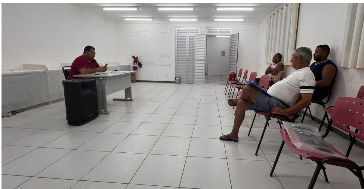
REUNIÃO EQUIPES ESPORTIVAS DO DISTRITO DE PRAIA DE GRANDE – ATIVIDADES DE VERÃO