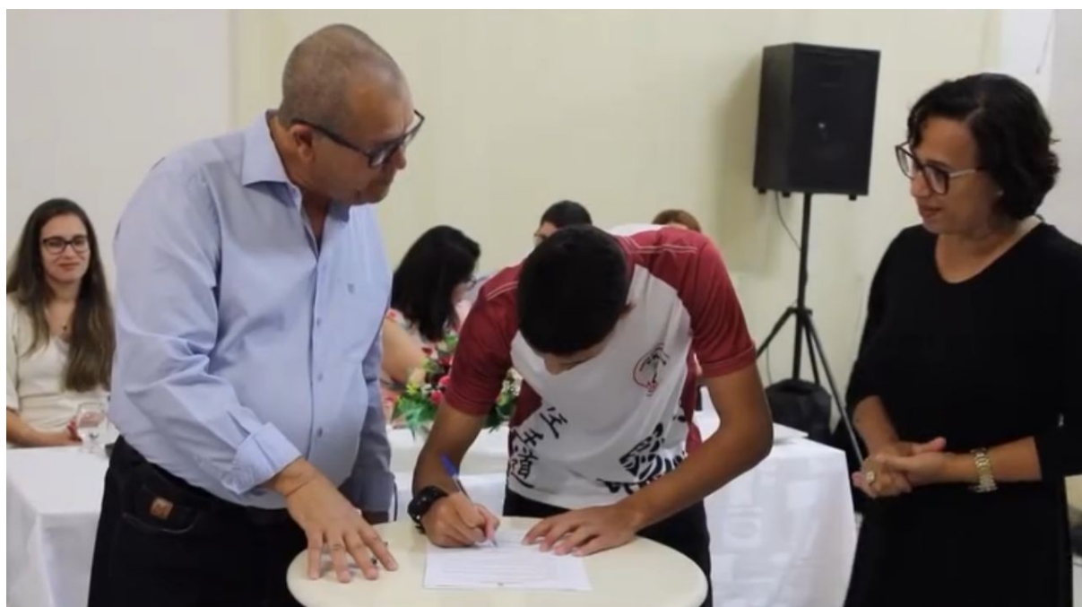
ASSINATURA DO TERMO DE ADESÃO DO PROGRAMA BOLSA ATLETA MUNICIPAL