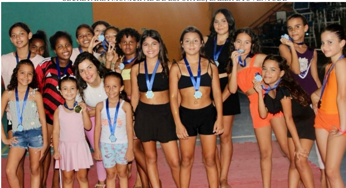
GINASTICA RÍTMICA – TIMBUÍ