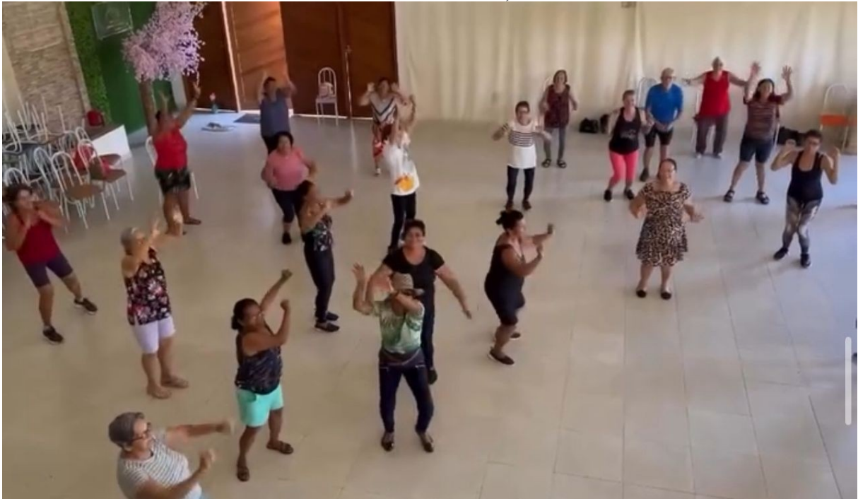
GINASTICA MELHOR IDADE – CENTRO