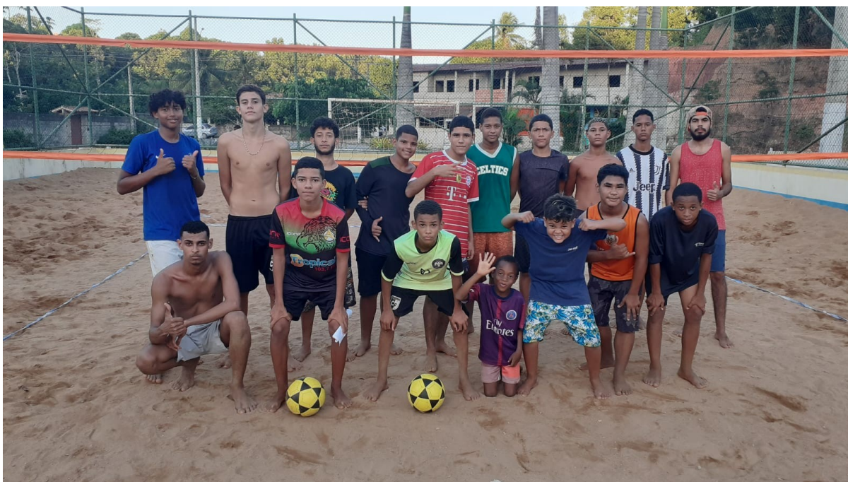
FUTEVÔLEI – PRAIA GRANDE