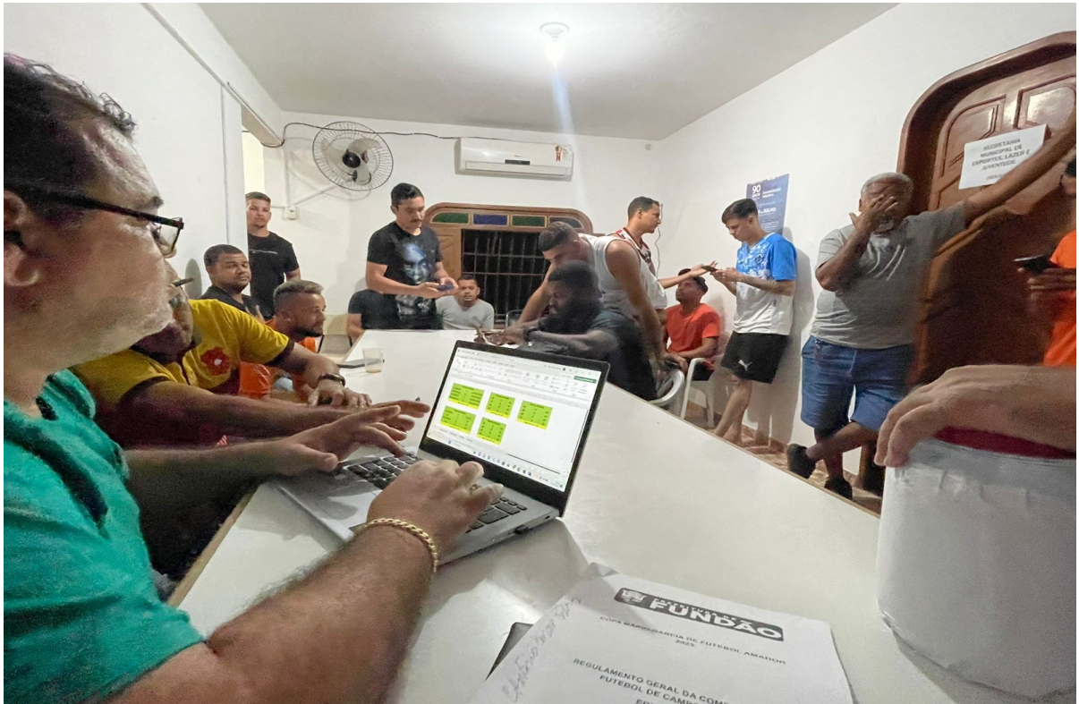
REUNIÃO REPRESENTANTES DAS EQUIPES DE FUTEBOL AMADOR – SORTEIO 4ª COPA MARIO GARCIA