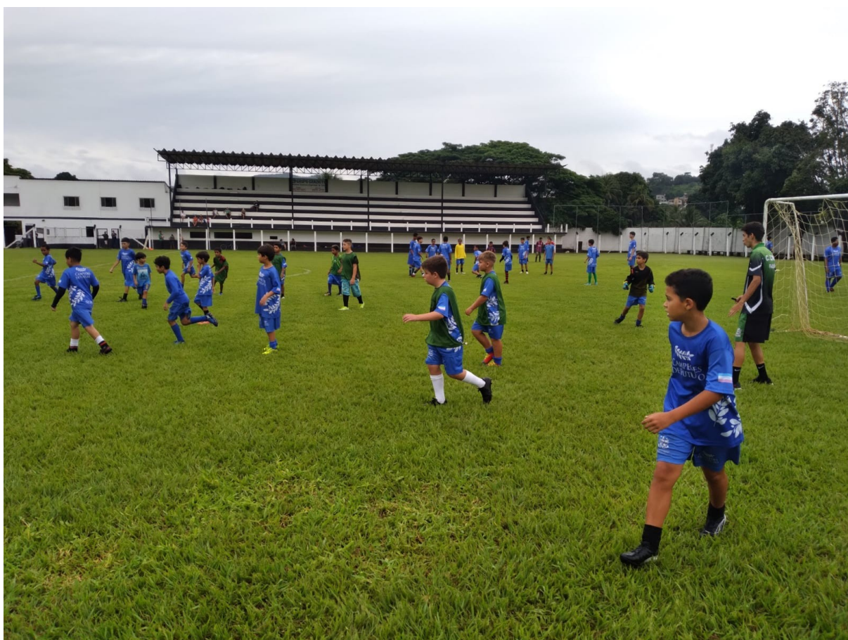
FUTEBOL DE CAMPO – CENTRO