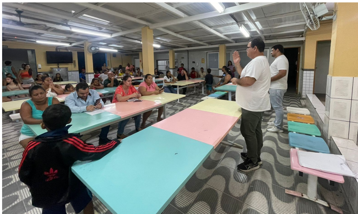
REUNIÃO COM OS PAIS E RESPONSÁVEIS TIMBUÍ PROJETO “BOM DE ESCOLA, BOM DE BOLA”