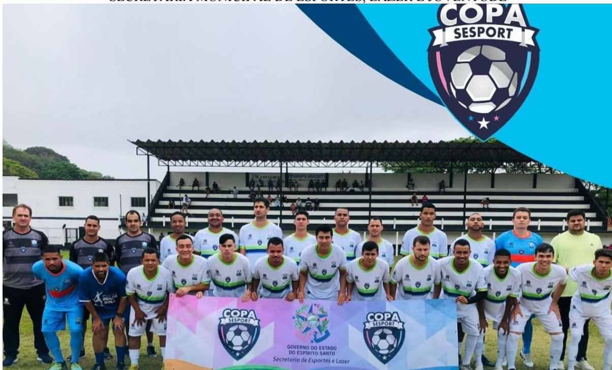
SELEÇÃO FUNDÃO – COPA SESPORT 2023