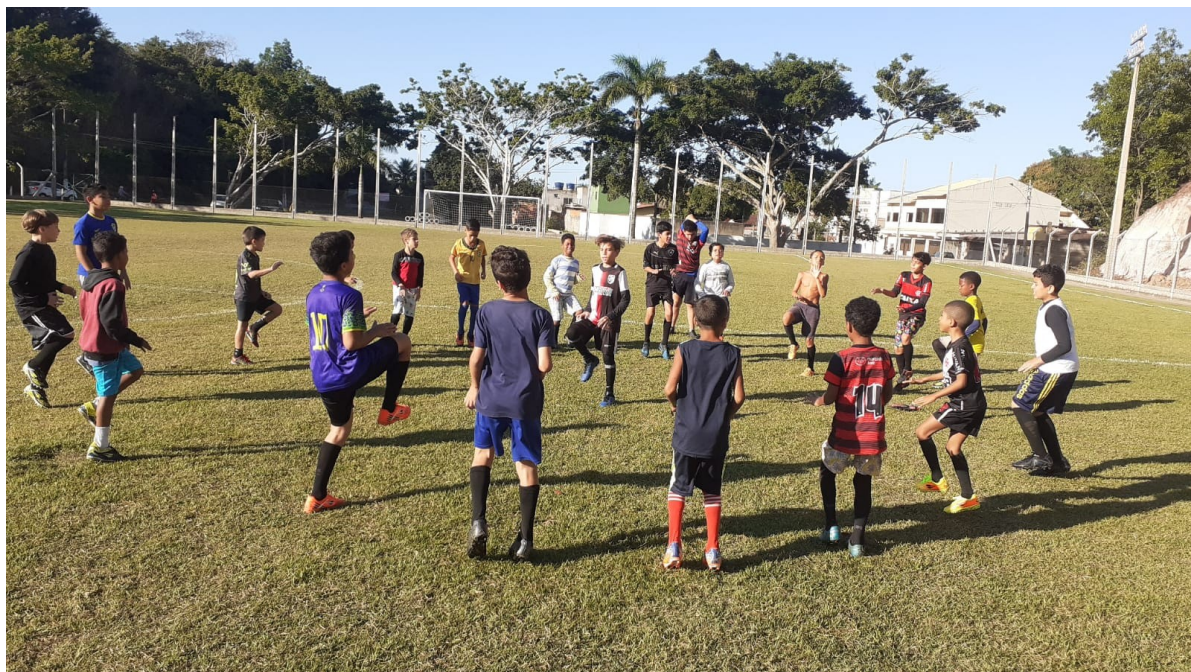
FUTEBOL DE CAMPO – PRAIA GRANDE