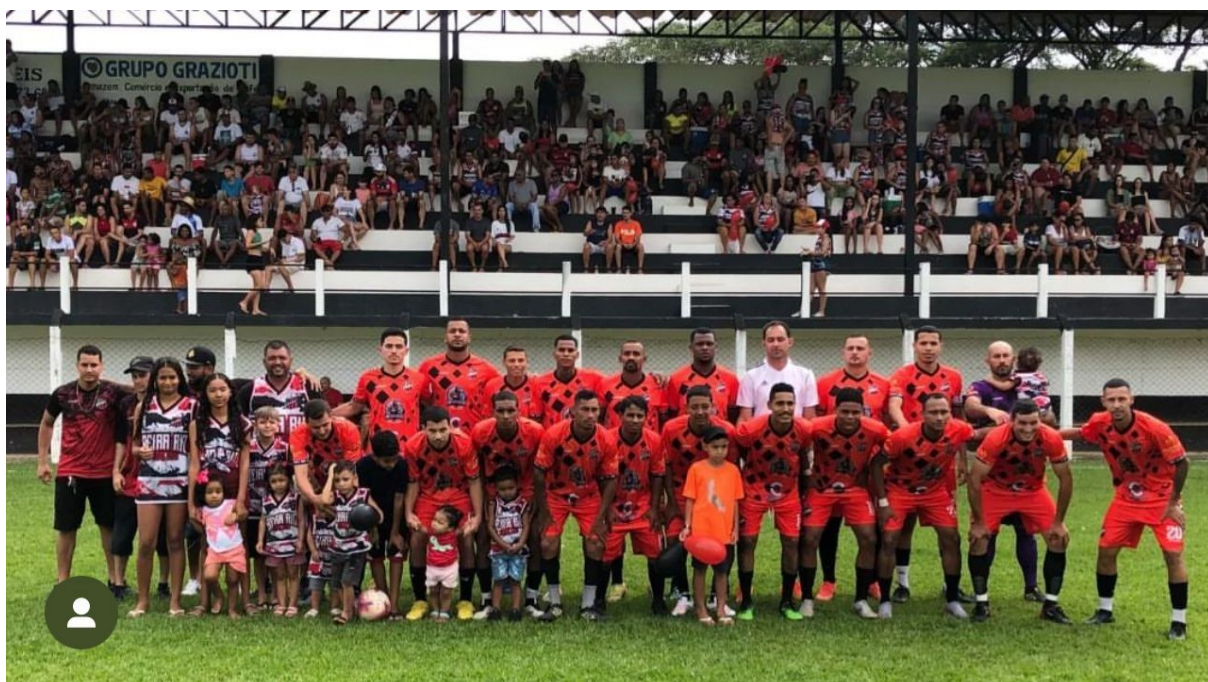
VICE-CAMPEÃO DA 4ª COPA MARIO GARCIA – BEIRA RIO F.C