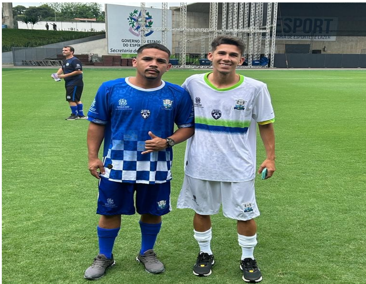
ENTREGA DOS MATERIAIS ESPORTIVOS PARA A COPA SESPORT 2023 – ESTÁDIO KLEBER ANDRADE