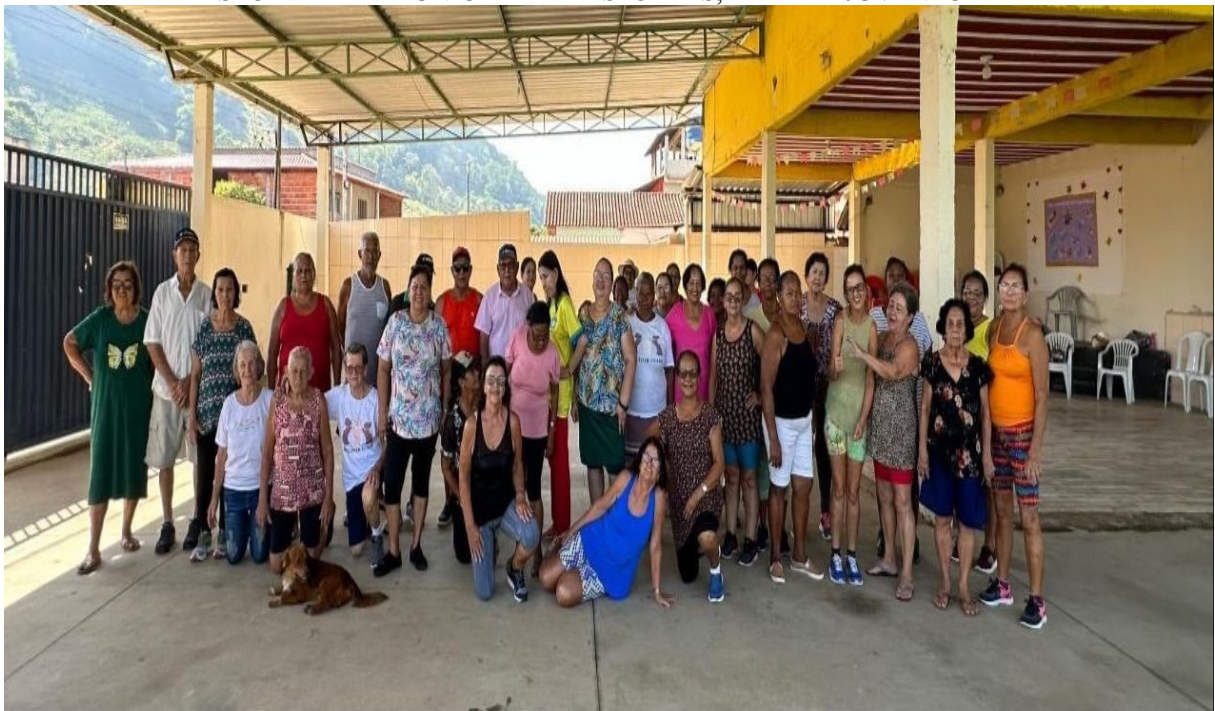
GINASTICA MELHOR IDADE – TIMBUÍ