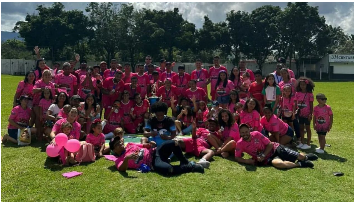
CAMPEÃO DA 4ª COPA MARIO GARCIA – GALÁCTICO F.C