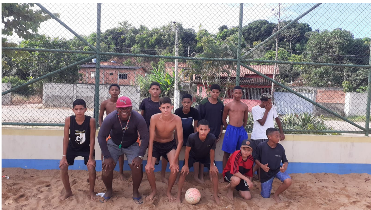
FUTEBOL DE AREIA – PRAIA GRANDE