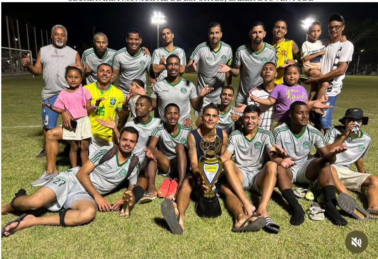
CAMPEÕES DO 19º TORNEIO DO DIA DOS PAIS – CEDRAZ F.C