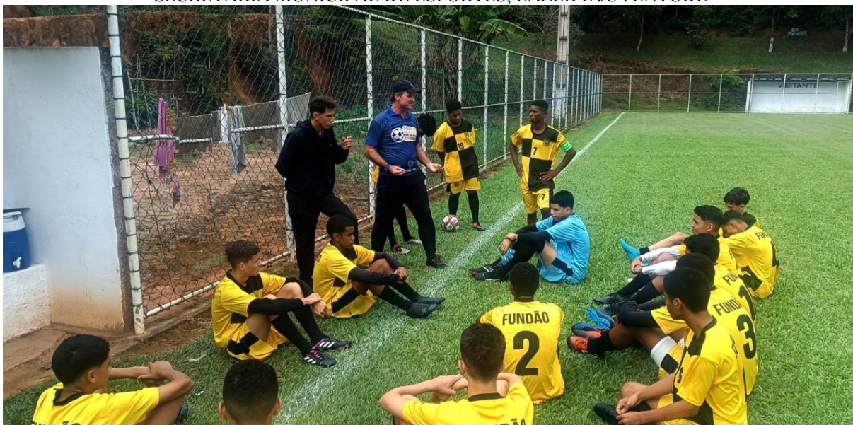
AMISTOSO FUNDÃO X SANTA TERESA