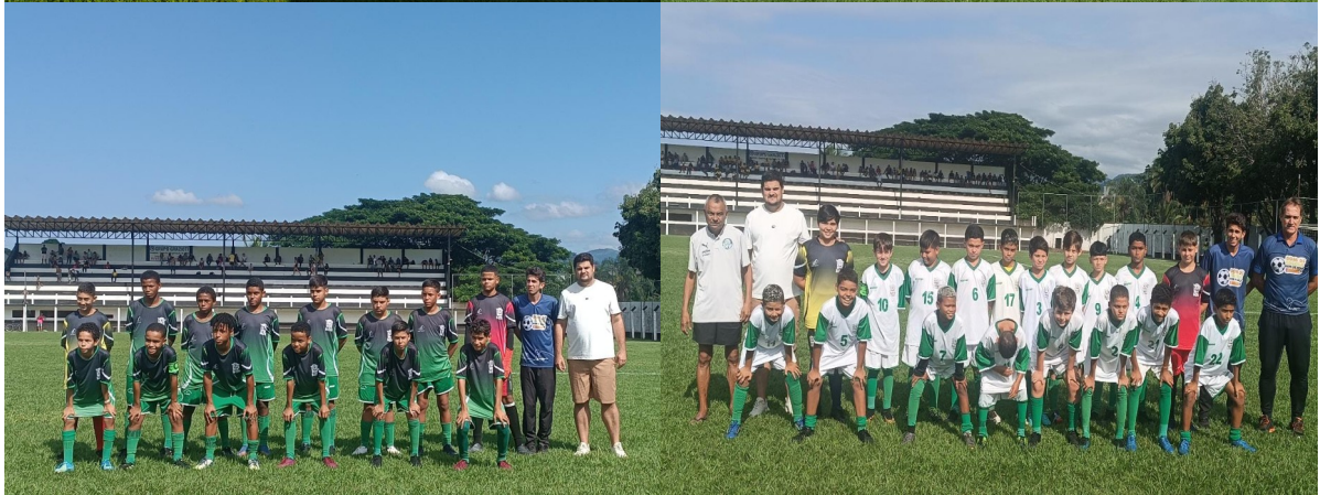
AMISTOSO FUNDAÇÃO X VITÓRIA