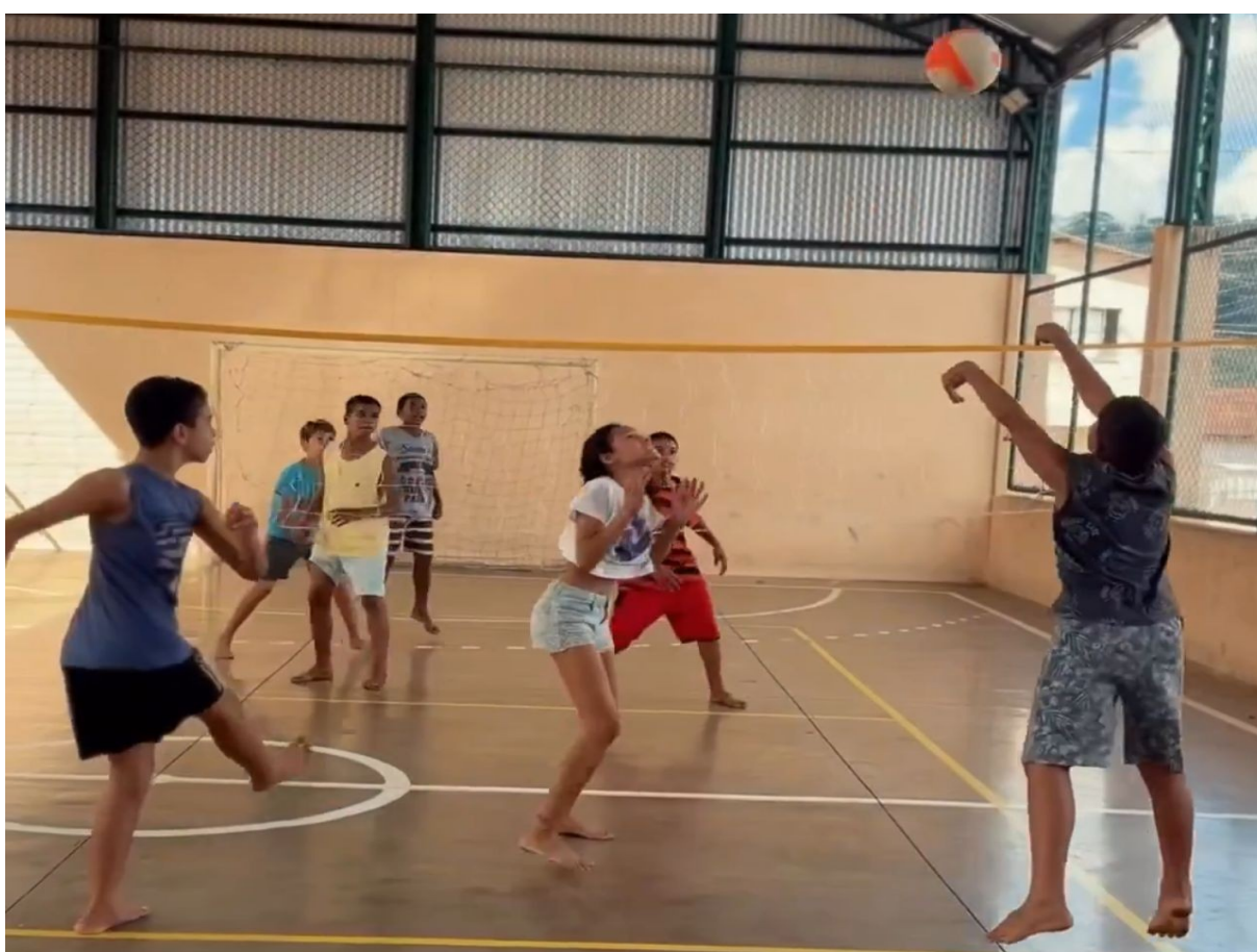
VÔLEI -- TIMBUÍ