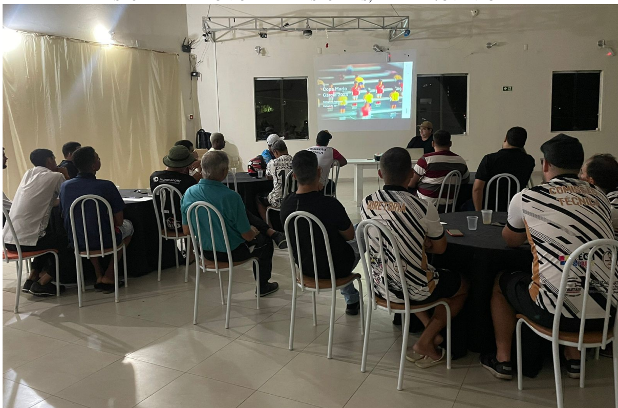
REUNIÃO COM AS EQUIPES DE FUTEBOL AMADOR MUNICIPAL - INFORMAÇÕES SOBRE A 5ª COPA MÁRIO GARCIA 2024