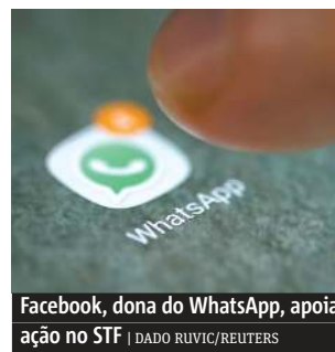
Facebook, dona do WhatsApp, apoia ação no STF

Um grupo de gigantes da tecnologia, como Microsoft e Facebook, pede ao STF (Supremo Tribunal Federal) que policiais, ministério público e judiciário brasileiros requisitem o conteúdo de conversas de usuários de seus serviços no país diretamente ao governo norte-americano e não às subsidiárias das empresas.