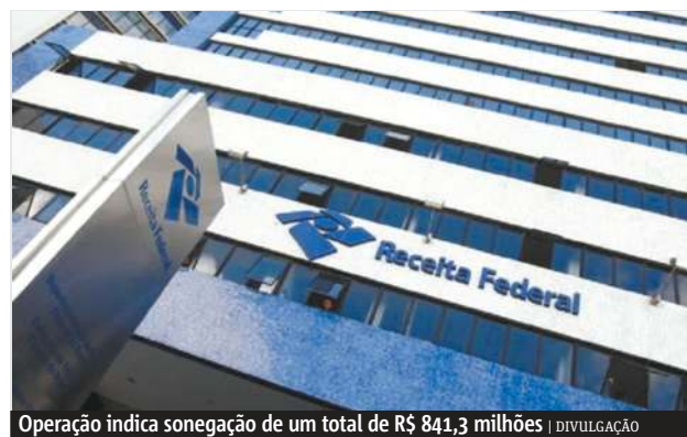
Operação indica sonegação de um total de R$ 841,3 milhões

Quem for notificado poderá efetuar o recolhimento dos valores devidos, com os respectivos acréscimos legais, até 31 de janeiro de 2018. O contribuinte que não regularizar sua situação estará sujeito, a partir de fevereiro, à fiscalização, podendo pagar multa de 75% a 225% do valor devido. Também poderá ser alvo de repre-